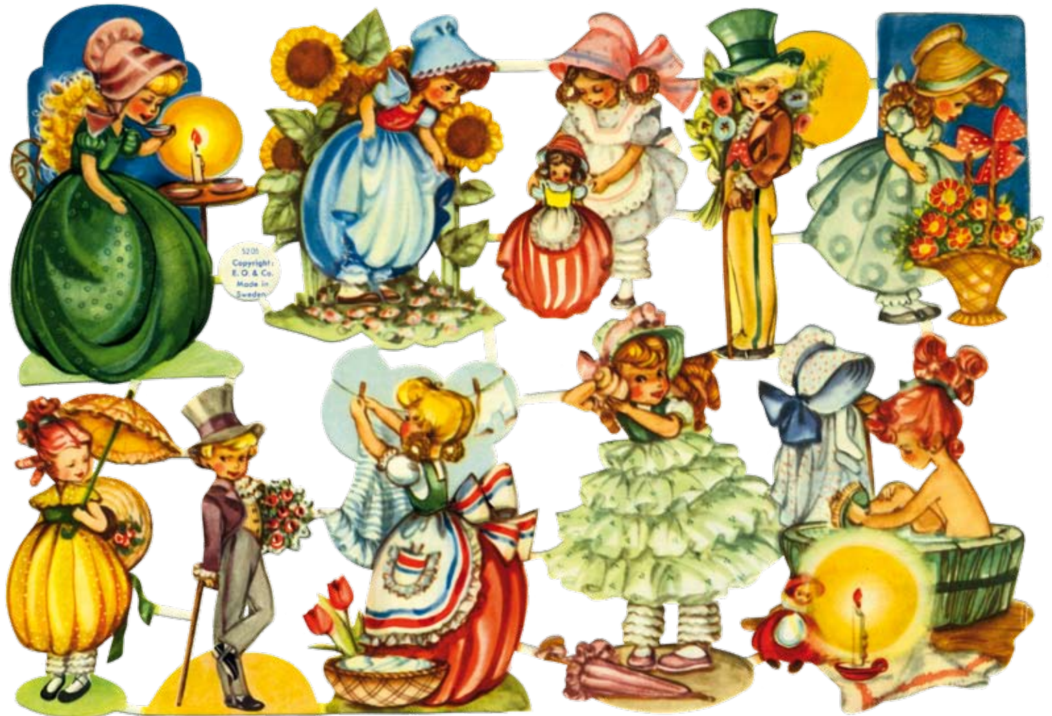
Smakprov ur Evalisa Agathons stora bokmärkesproduktion.