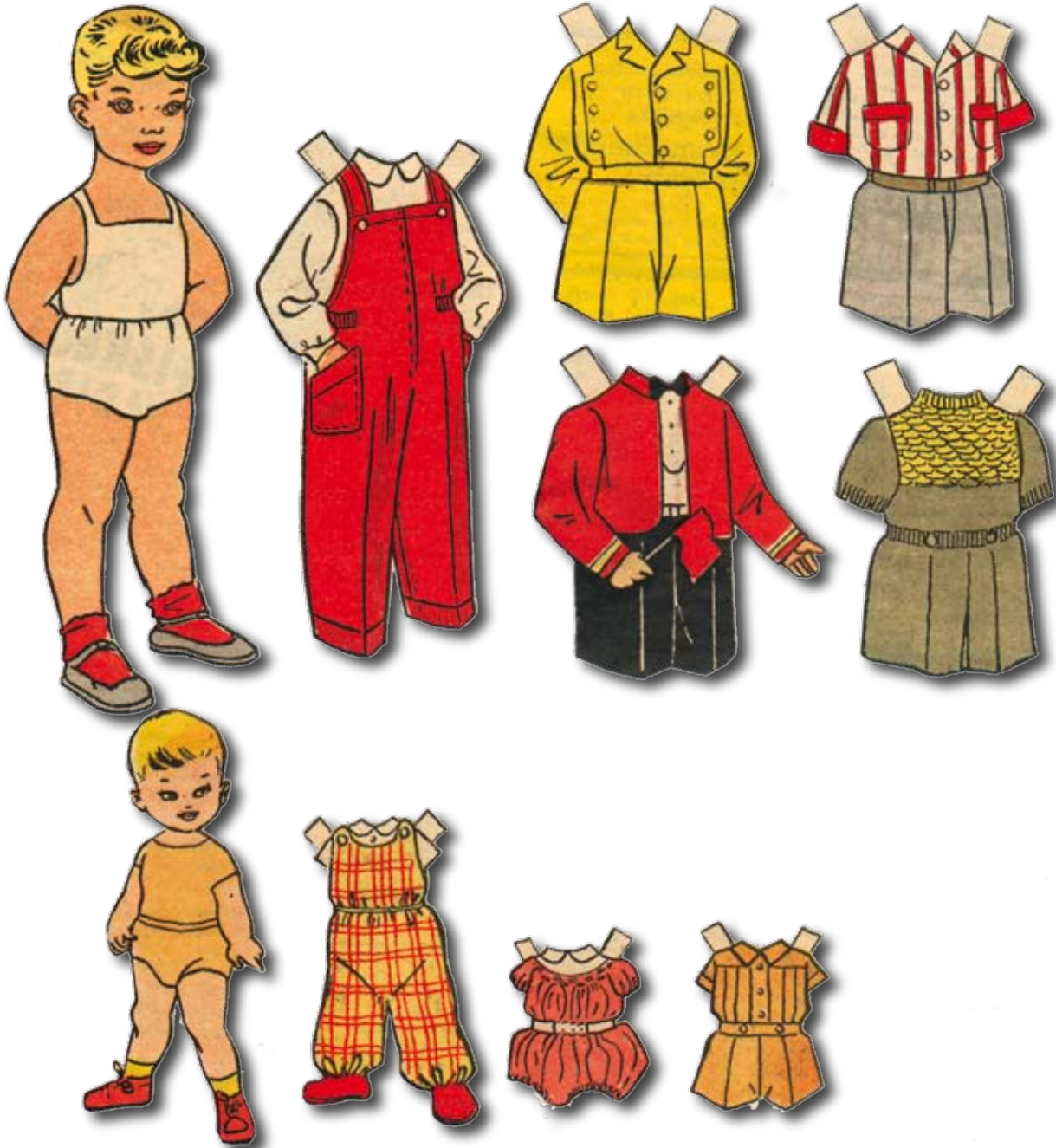
Små dockor från 1950-talet, ur Hemmets veckotidning.